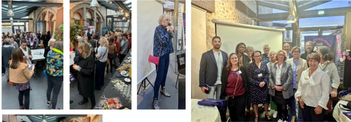
1er octobre La Force du Collectif