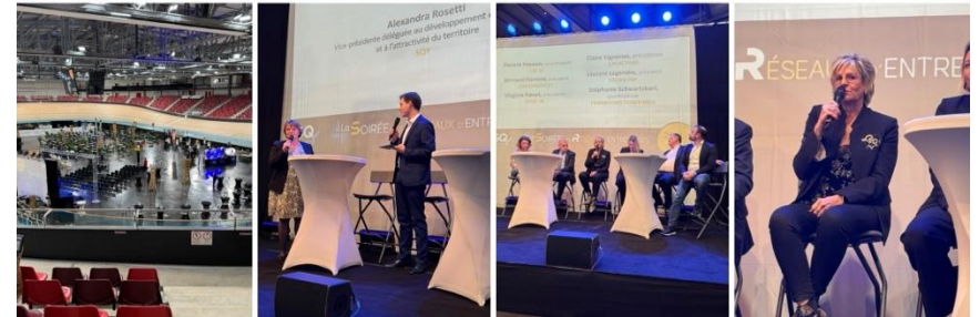
Soirée des réseaux SQBD 28.11