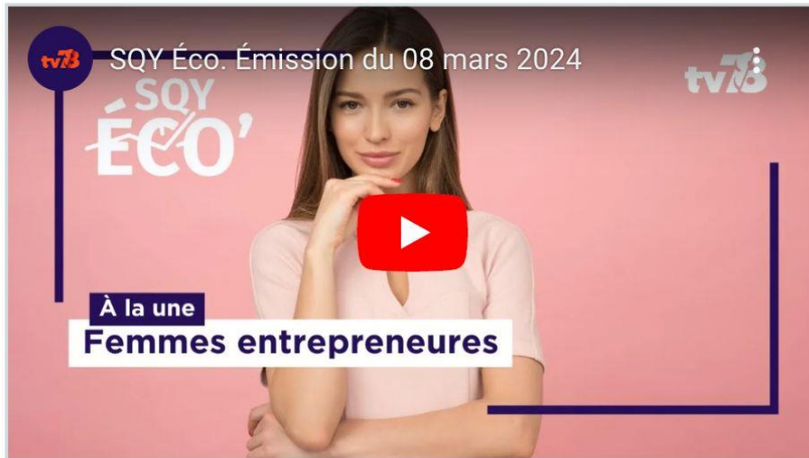
Interview de CréActive par TV78

L'Ibis du Vélodrome reste notre camp de base officiel avec une gentillesse du directeur et un accueil des équipes toujours inégalés !